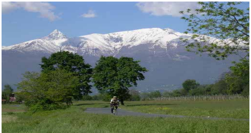
Vélo-voyage en Italie