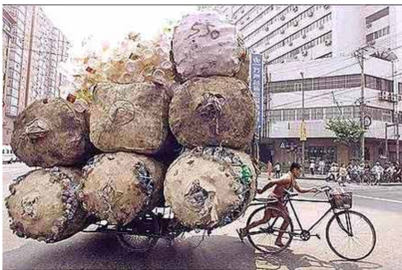
Chef de file écolo (Chine)