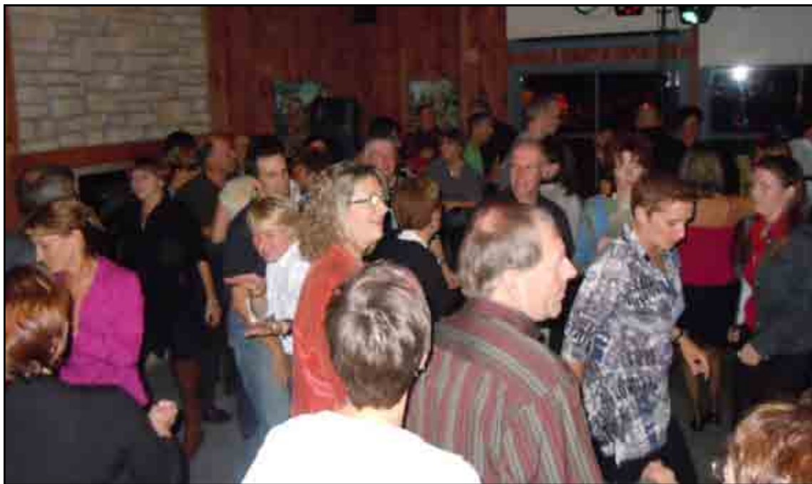
Soirée de clôture 2010