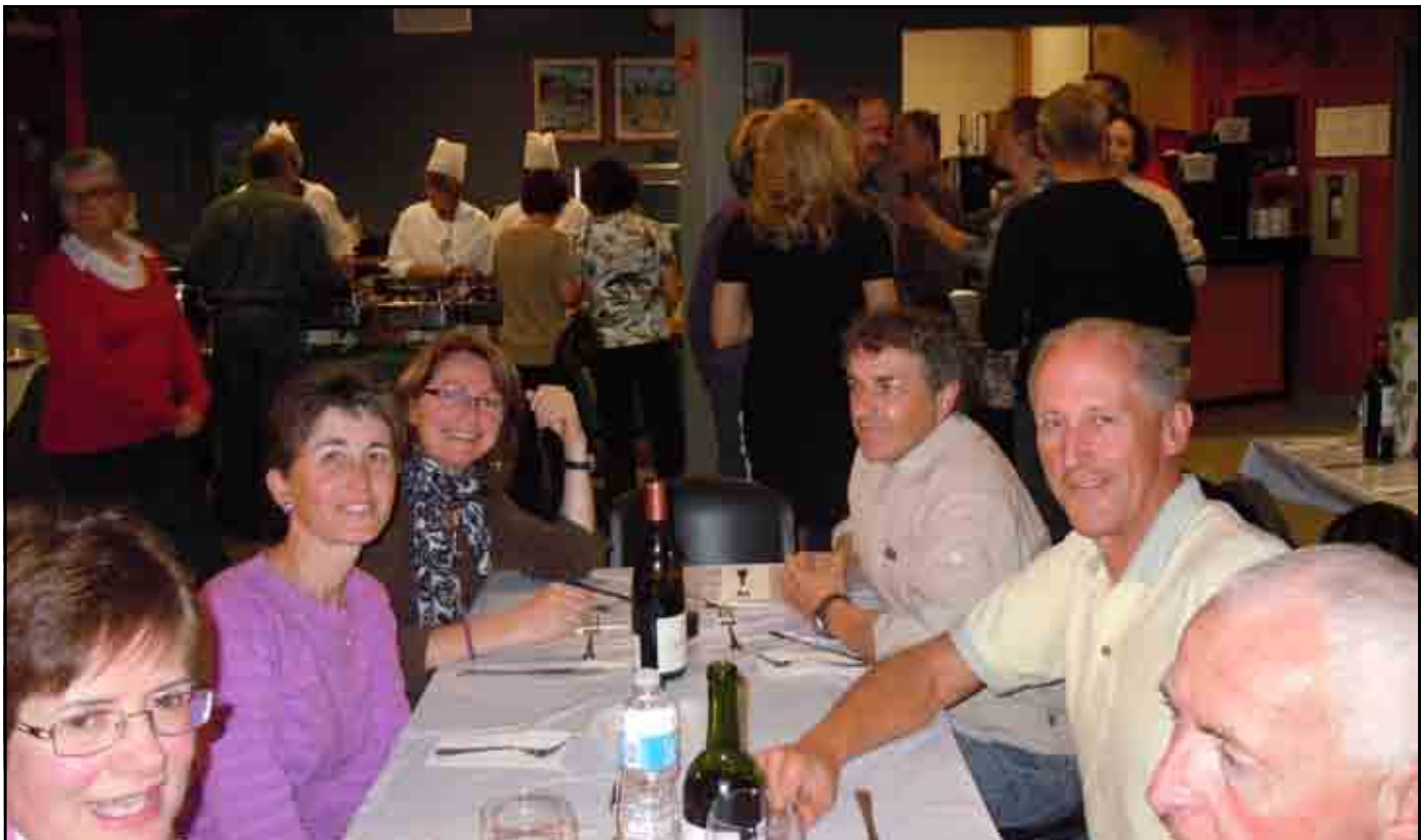
Souper de clôture 2010.