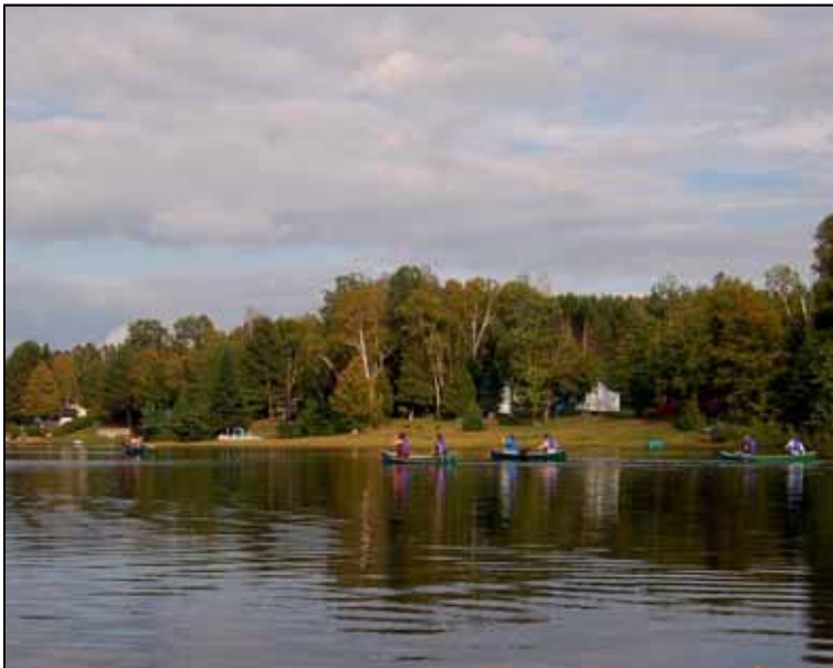
Automnale 2008 – C'est aussi ça...