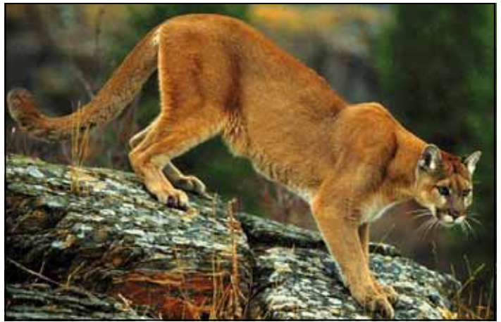
Un cougouar observé dans le parc...

Les associations nantaises de cyclistes urbains (Vélocampus, Place au Vélo, Cyclocab et Dynamots) organisent le 3 e mercredi de chaque mois une balade