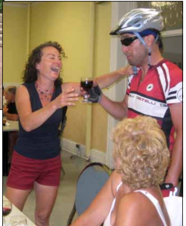
Un bon verre de vin au retardataire — Parti de Gatineau à 16 h à toute vitesse pour retrouver le groupe à Kemptville en temps pour le souper et les festivités de la soirée.