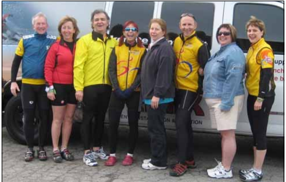
Le comité organisateur de la Printanière 2008

La Printanière 2008, un grand succès! Près de 90 hardis cyclistes se sont baladés sur les routes de la Haute-Gatineau lors de la « Printanière 2008 », subissant un fort vent de face samedi et encore dimanche. Bravo à toutes et à