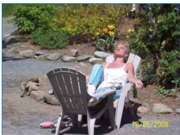
La randonnée en Estrie — La petite misère...