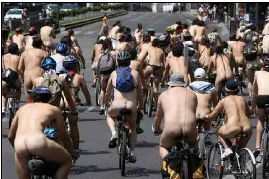
Manifestation mondiale à vélo nu

automobilistes et des cyclistes nous ont été rapportés cette année, ce qui n'est pas pour améliorer les choses!