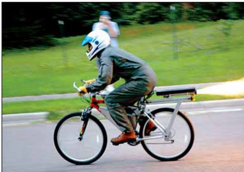
« Rocket-bike, c'est avoir le feu quelque part... ou encore, c'est pété le feu... ou encore, c'est... »

d'information de Vélo Québec ou au www.velo.qc.ca .