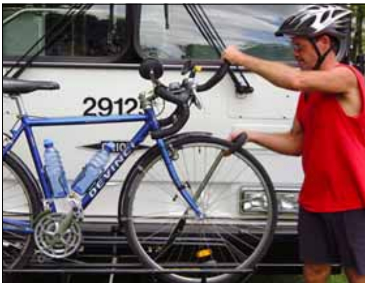
Les supports à vélo sur autobus

Les supports à vélo sur autobus : le point sur la situation. Depuis 2002, les supports à vélo ont fait leur apparition sur une centaine d'autobus de sociétés de transport en commun de