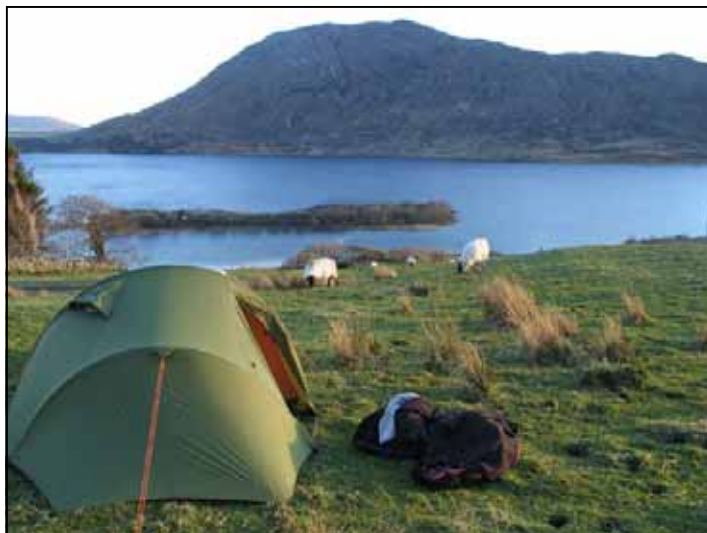
À des kilomètres à la ronde, que des moutons.

Je crois que les Irlandais ont un petit faible pour les jeunes Canadiennes-françaises à vélo. Trois d'entre eux ont tenté de m'embrasser. J'aurais bien aimé pouvoir plier l'un de ces prétendants et le mettre dans ma poche pour le ramener avec moi. C'était le vieil Irlandais typique qu'on voit partout sur les cartes postales : ridé, édenté, vêtu d'un costume noir (c'était dimanche matin; il était sûrement en route pour la messe) et monté sur une vieille bicyclette. Il tenait absolument à me trouver un mari. Sans doute avait-il en tête un de ses petits-fils. « Kiss me love and I'll be on me way ! » Je le trouvais si mignon que j'ai déposé un bec sur sa joue rugueuse. Et, sur ce, il a enfourché sa monture et est parti sans demander son reste, comme un cowboy vers le soleil couchant.